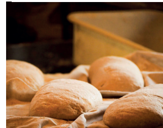
Les Champs du pain

ou sur la carte de la Route des Savoir-Faire et des Sites Culturels (disponible gratuitement dans les offices de tourisme du massif).