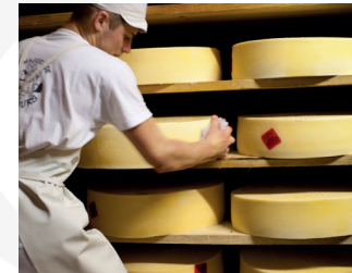
Coopérative Ici en Chartreuse