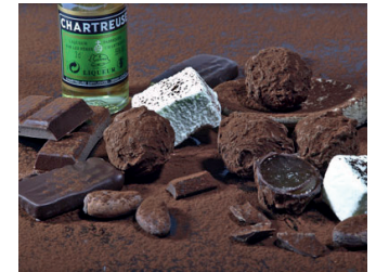
Chocolaterie Sandrine Chappaz