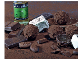
Chocolaterie Sandrine Chappaz