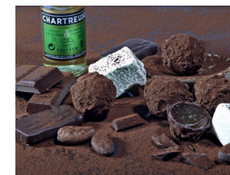
Chocolaterie Sandrine Chappaz