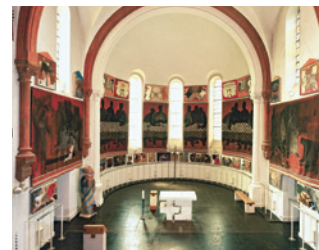
Musée Arcabas en Chartreuse

ou sur la carte de la Route des Savoir-Faire et des Sites Culturels (disponible gratuitement dans les offices de tourisme du massif).