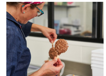
Eclat des Cimes