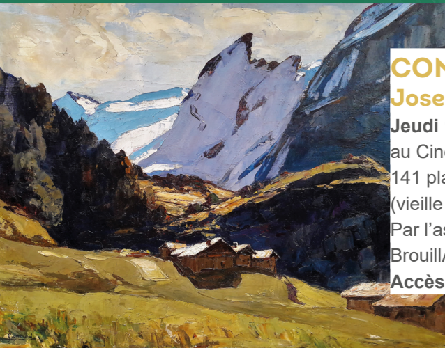
Joseph Communal, Pralognan , huile sur panneau, 70 x 92 cm, collection particulière.

L'artiste, membre de la Société des peintres de montagne, a peint les massifs et les vallées du Dauphiné jusqu'à la Savoie. Travaillant au couteau, sur toile ou sur panneau de bois, il sculpte la matière picturale jouant avec la lumière, parfois en clair-obscur. La gamme de couleur est très contrastée, parfois rutilante à l'image des couchers de soleil sur la montagne. Les visiteurs pourront découvrir les somptueux décors des Alpes ainsi que les paysages inspirés par ses voyages.