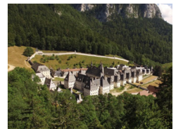
Musée de la Grande Chartreuse