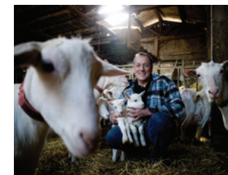
Ferme de Plantimay