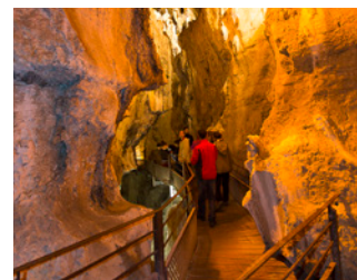
Grottes de St Christophe

Informations et autres idées de visites sur www.destinationchartreuse.fr/rsf ou sur la carte de la Route des Savoir-Faire et des Sites Culturels (disponible gratuitement dans les offices de tourisme du massif).