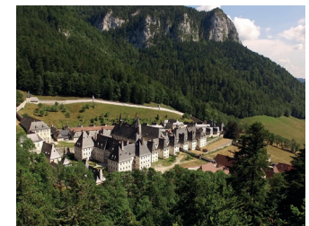
Musée de la Grande Chartreuse