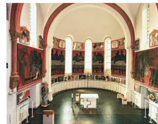
Musée Arcabas en Chartreuse