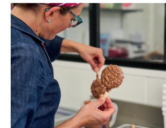
Eclat des Cimes