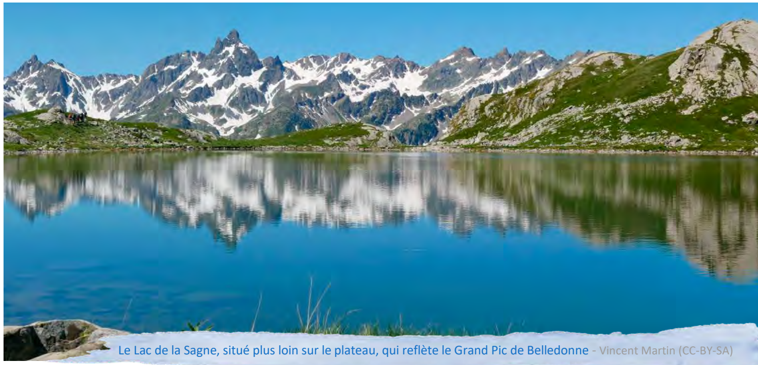
Le Lac de la Sagne, situé plus loin sur le plateau, qui reflète le Grand Pic de Belledonne