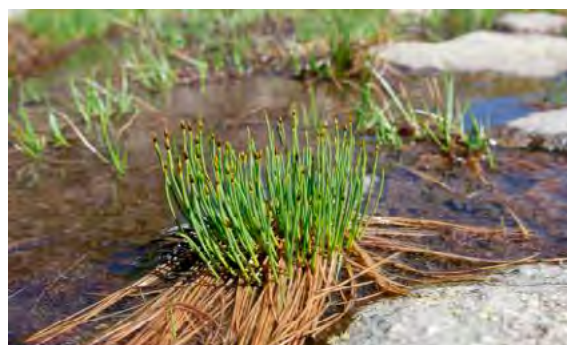
Un milieu végétal à préserver

Ce programme associant scientifiques et gestionnaires des espaces naturels a pour but d'améliorer la compréhension du fonctionnement et des menaces qui pèsent sur ces lacs afin de mieux les préserver. En particulier dans le contexte du réchauffement climatique, de nombreux paramètres y sont étudiés : température, couleur et turbidité de l'eau (teneurs en particules), pollutions, etc.