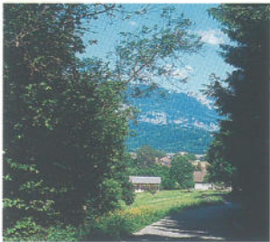
Route du Grépon . Photo C.Maurel

Le chaînon de Miribel est encore jurassien; il est coupé au nord par le Guiers aux gorges de Chailles et se poursuit par les collines de Miribel jusqu'aux environs de Voreppe. Vous êtes donc dans un avant-pays jurassien de la Chartreuse.