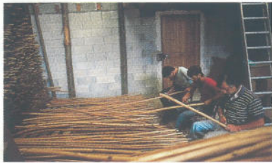
Fabrique de cannes à Entre-Deux-Guiers