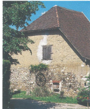
Habitat traditionnel .

La vallée de Chartreuse a connu une intense activité autour du travail du bois. Celui-ci était travaillé dans des tourneries, des tabletteries, des scieries qui produisaient des produits de toute sorte. Cette activité se perpétue aujourd'hui dans la papeterie avec l'entreprise MATUSSIÈRE, et surtout par une dynamique activité artisanale avec notamment la fabrique de cannes de marche, de la tournerie et de la tabletterie.