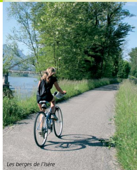
Les berges de l'Isère

Retour après avoir retraversé la D48a, par le Château, les Pautres, Verdemont, les Moiles, le Manguely, les Massons jusqu'au pont de St-Quentin. À l'entrée du pont, retrouver à gauche la piste cyclable sur berge pour le retour au point de départ à Grenoble. Itinéraire facile mais relativement long pour flâner le long des berges de l'Isère et traverser une multitude de petits hameaux.