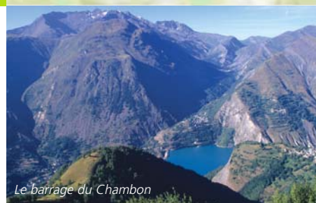
Le barrage du Chambon

Au départ de Bourg-d'Oisans, prendre la D1091 en direction de Grenoble. A Rochetaillée, bifurquer à droite sur la D526 vers Allemont et entamer la longue et difficile montée à l'assaut de la Croix de Fer en passant par le Rivier-d'Allemont, le barrage de Grand Maison par la D926 (incursion dans le Département de la Savoie). Au passage, laisser sur la gauche le col du Glandon. Après la Croix de Fer, prendre la longue et vertigineuse descente sur St-Sorlin-d'Arves, St-Jean-d'Arves jusqu'à St-Jean-de-Maurienne. Remonter la vallée de la Maurienne par la N6 jusqu'à St-Michel-de-Maurienne. De là, prendre à droite la D902 pour s'attaquer au second col de la journée, le col du Télégraphe et accéder à la station village de Valloire. Après avoir traversé Valloire, partir à l'assaut du morceau de choix de la journée, le col